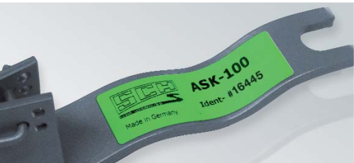
Aufkleber mit Identifikations-Nr. und Serienbezeichnung