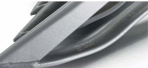
Eingestanztes SCH-Logo in der Gleitkuife