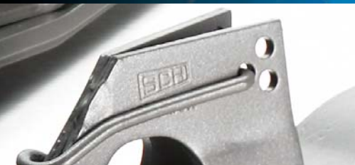
Eingestanztes SCH-Logo auf der Befestigungstasche