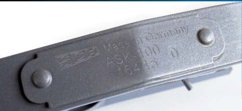
Signierung auf dem Verstärkungsplättchen